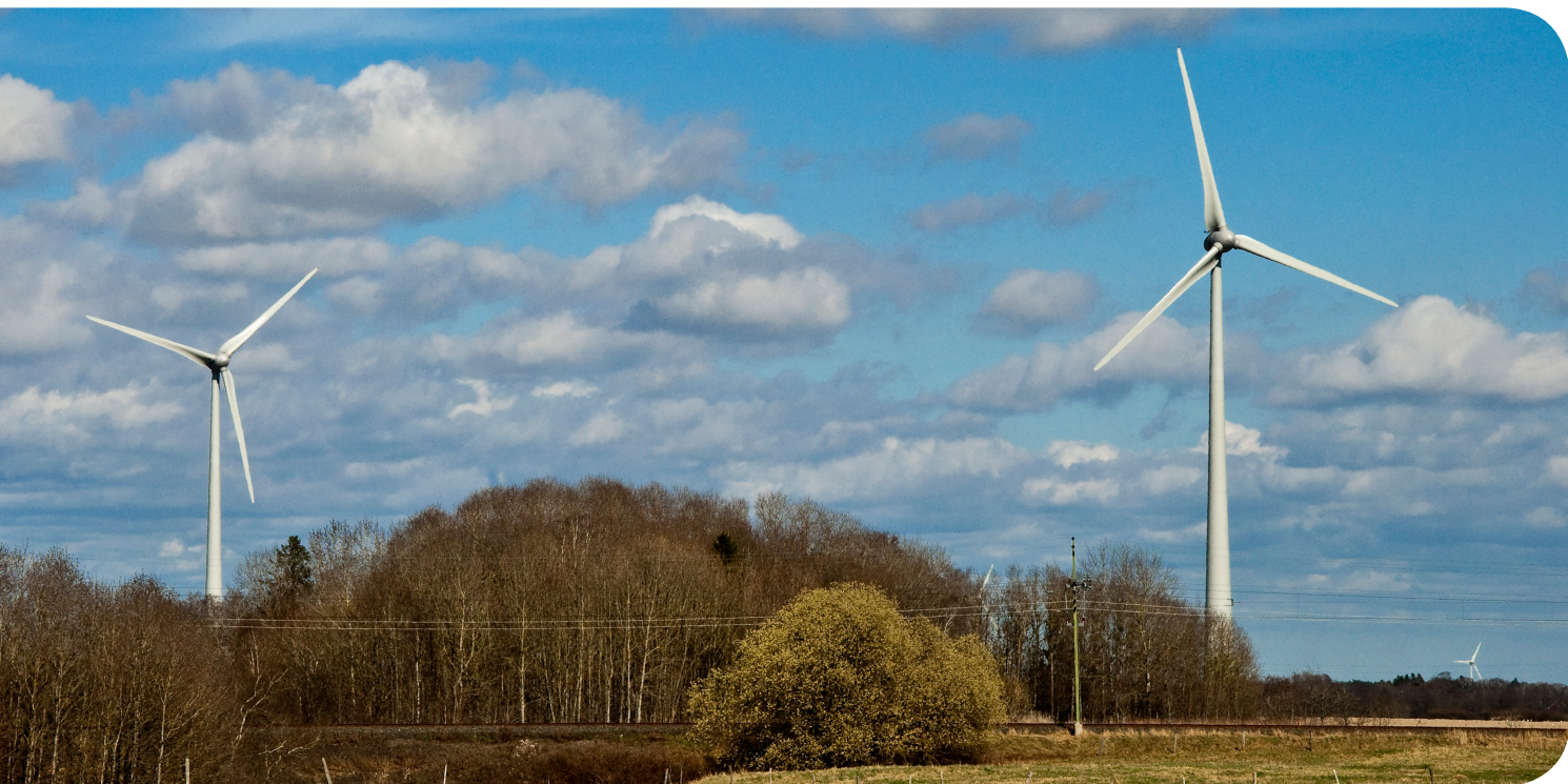
Håkantorps vindpark, Vara kommun

El producerad från följande energikällor berättigar till elcertifikat: vindkraft, solenergi, vågenergi, geotermisk energi, biobränslen, småskalig vattenkraft samt torv i kraftvärmeverk.