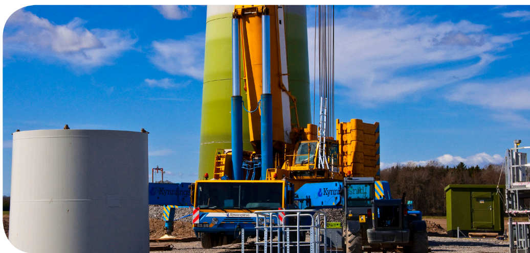
Närefors vindpark, Lidköpings kommun

Som vid alla investeringar finns det riskfaktorer. Priset på el och elcertifikat är de tydligaste. Sedan påverkar även ränteläget då det handlar om kapitalintensiva investeringar. Det måste också finnas en medvetenhet om att vind är en naturresurs som varierar mellan åren precis som vattentillgången påverkar fyllnadsgraden i vattenmagasinen. Intäkterna från vindkraft kan därmed variera över åren.