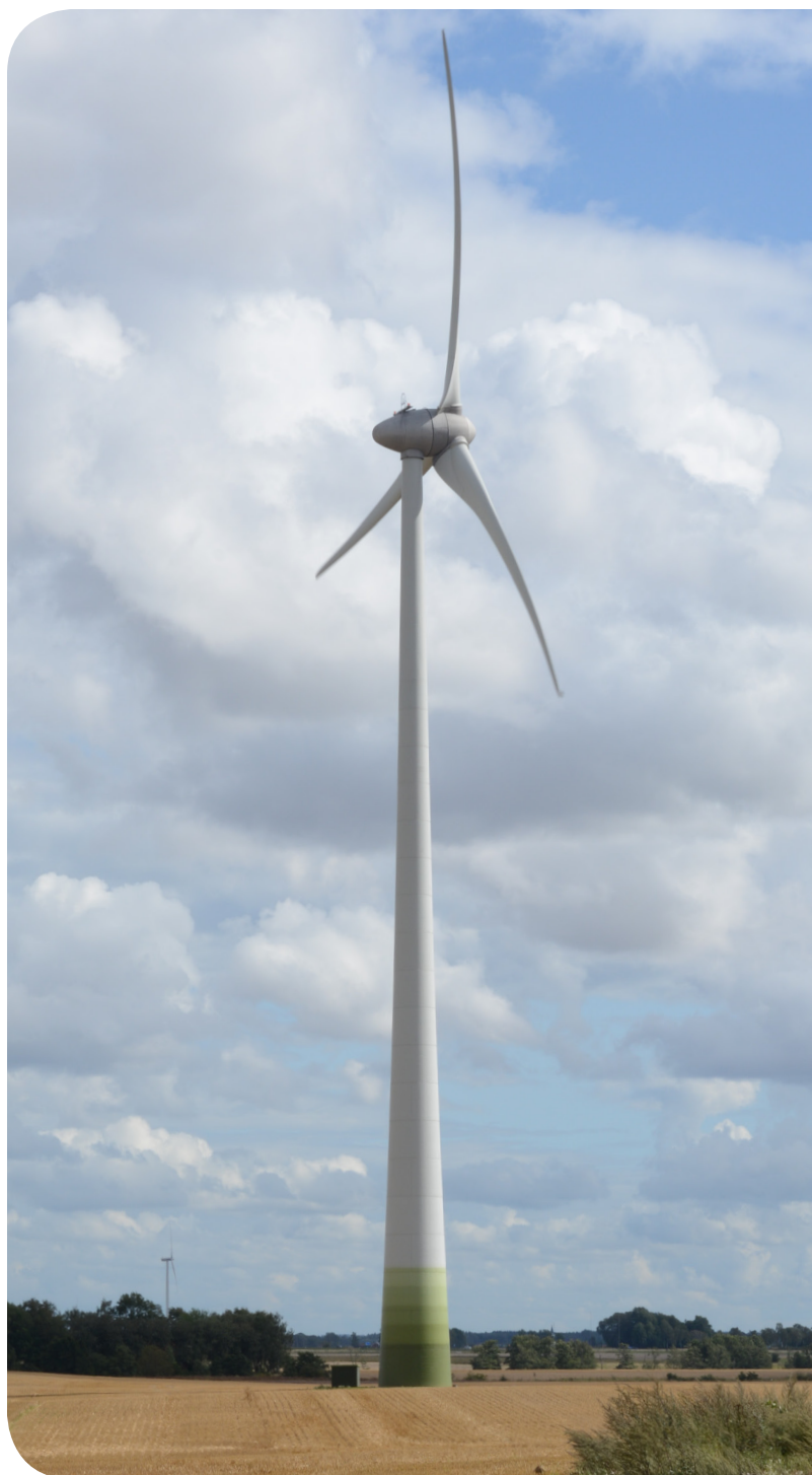
Håkantorps vindpark, Vara kommun