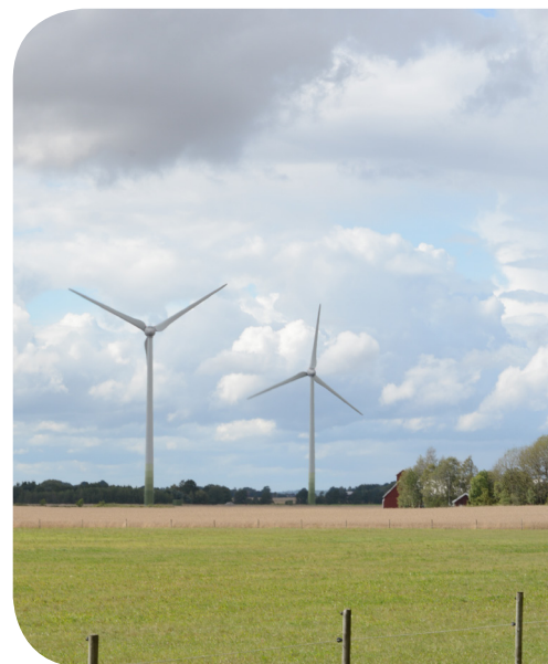
Hästhalla Vindpark, Vara kommun