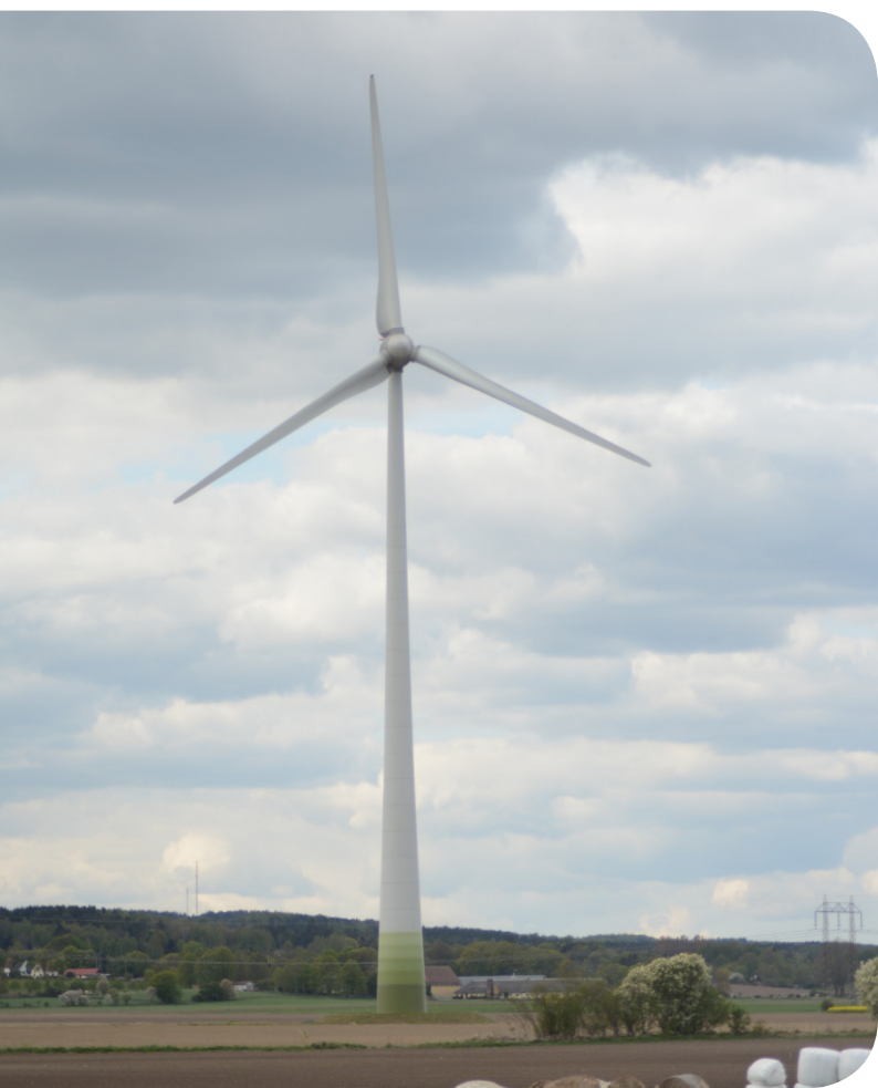
Igrannatorp vindpark, Kristianstad kommun