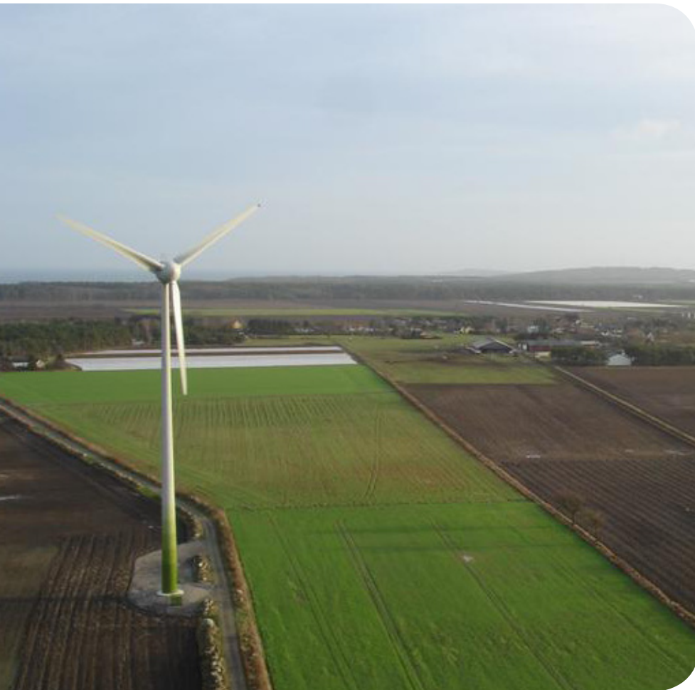
Lörby vindpark, Sölvesborg kommun

Serviceavtalet innehåller även en tillgänglighetsgaranti på 97 %.