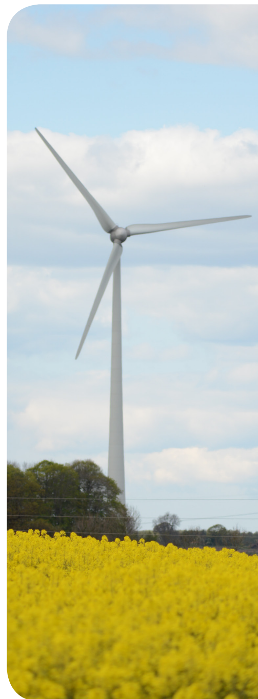
Isgrannatorp vindpark, Kristianstad kommun

Enercon fullserviceavtal och Eolus drifttjänster utgör tillsammans ett fullservicekoncept för ett tryggt och bekymmersfritt ägande.