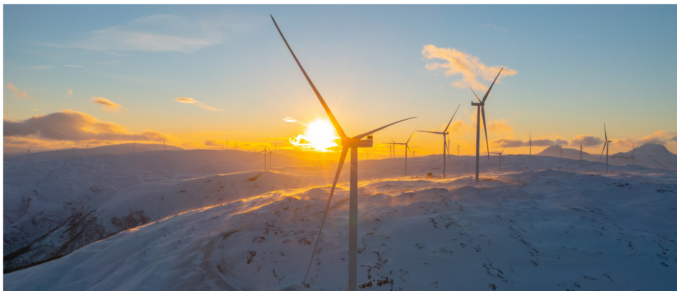
Øyfjellet Wind Farm